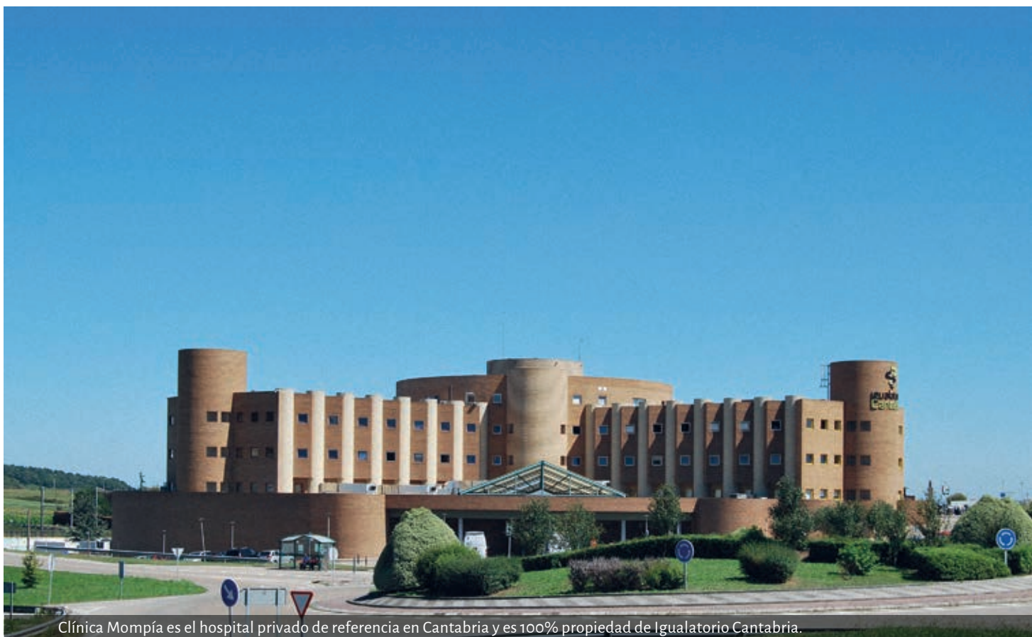
Clínica Mompía es el hospital privado de referencia en Cantabria y es 100% propiedad de Igualatorio Cantabria.

Igualatorio Cantabria es la empresa sanitaria privada más importante de la región. Nacida en 1952 de la unión de unos pocos médicos, ha evolucionado hasta convertirse en una pujante compañía que mantiene su espíritu cooperativista.