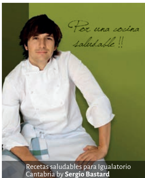
Recetas saludables para Igualatorio Cantabria by Sergio Bastard

La investigación médica es otra área fundamental de nuestra Responsabilidad Social Corporativa. De ahí que parte de nuestros beneficios se hayan destinado a Cellbiocan, primera empresa biotecnológica de nuestra región, que se dedica a la creación de biosensores para la detección de células tumorales circulantes, que permitirán predecir la evolución de la enfermedad y la respuesta a los tratamientos.