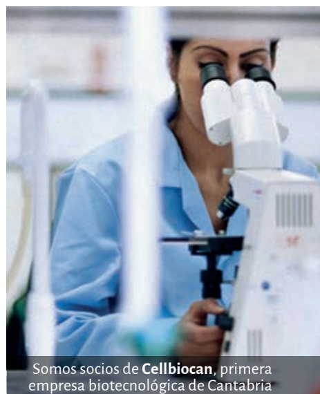
Somos socios de Cellbiocan, primera empresa biotecnológica de Cantabria