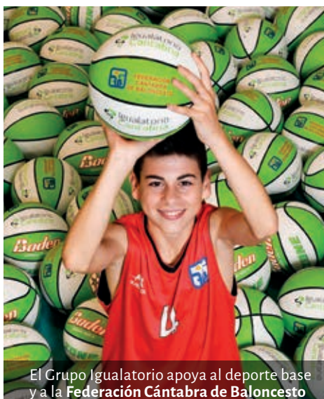
El Grupo Igualatorio apoya al deporte base y a la Federación Cántabra de Baloncesto