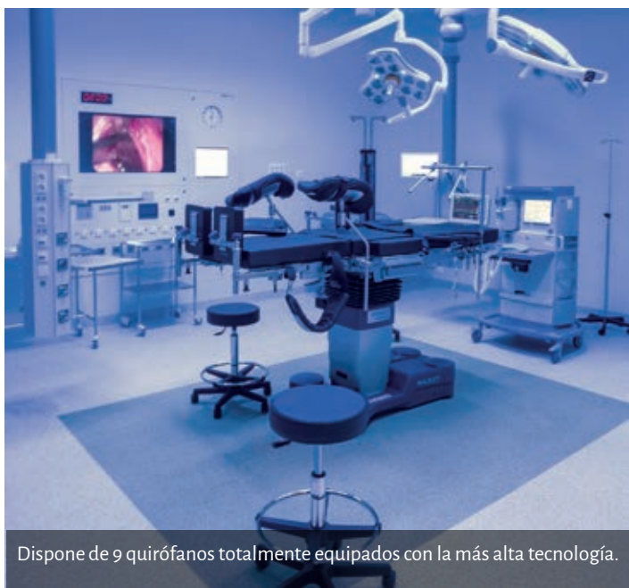
Dispone de 9 quirófanos totalmente equipados con la más alta tecnología.

CLÍNICA MOMPÍA DISPONE DE MODERNAS INSTALACIONES PARA LOS PRÓXIMOS 25 AÑOS