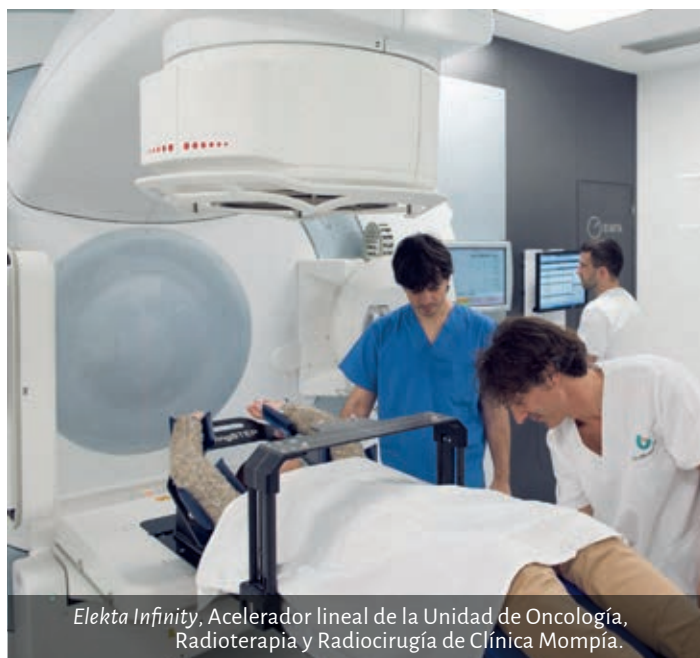
Eleka Infinity, Acelerador lineal de la Unidad de Oncología, Radioterapia y Radiocirugía de Clínica Mompía.

Referente oftalmológico en Cantabria, la Unidad de Cirugía Refractiva de Clínica Mompía es pionera en técnicas de última generación mediante láser excimer y se ha consolidado por su alta calidad asistencial en la corrección de los defectos refractivos. Emplea los más sofisticados medios de diagnóstico y tratamiento, incluido el equipo de Láser Excimer Visx Star S4 IR™, especialmente diseñado para realizar una cirugía personalizada, con diferentes tipos de tratamiento adaptados a las características propias de cada paciente, de un modo rápido, eficaz y seguro.